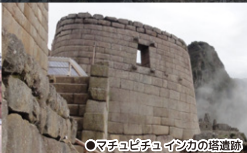
●マチュピチュ インカの塔遺跡