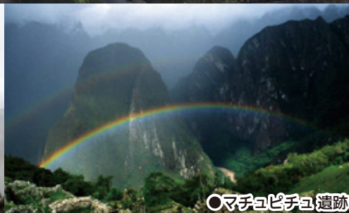
●マチュピチュ遺跡